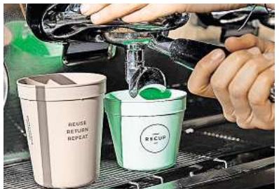
In Leipzig sollen künftig Mehrweglösungen gefördert werden.

Sie lobte dagegen den Kompromissantrag der SPD. „Dass dieser modifizierte Antrag in der finalen Abstimmung ausgerechnet durch eine Blockade-Allianz aus AfD, Linken und großen Teilen der Grünen zu Fall gebracht wurde, macht fassungslos. Damit verharnt Leipzig nun in einer abfallpolitischen Sackgasse ohne jede rechtliche oder ökologische Verbindlichkeit“, sagte Falkowski weiter.